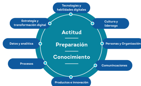
Imagen 1. Modelo de medición de madurez digital

Dentro de este proceso se evalúan las siguientes dimensiones: Tecnologías y habilidades digitales, Productos e innovación, Cultura y liderazgo, Personas y organización, Procesos, Comunicaciones, Datos y analítica, Estrategia y transformación digital. Permitiendo caracterizar y calificar a las empresas en cinco niveles de madurez digital (Inicial, Novato, Competente, Avanzado y Experto).